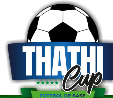
Tabela válida - Jan/24